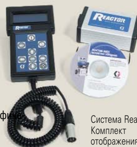
Система Reactor Комплект отображения данных